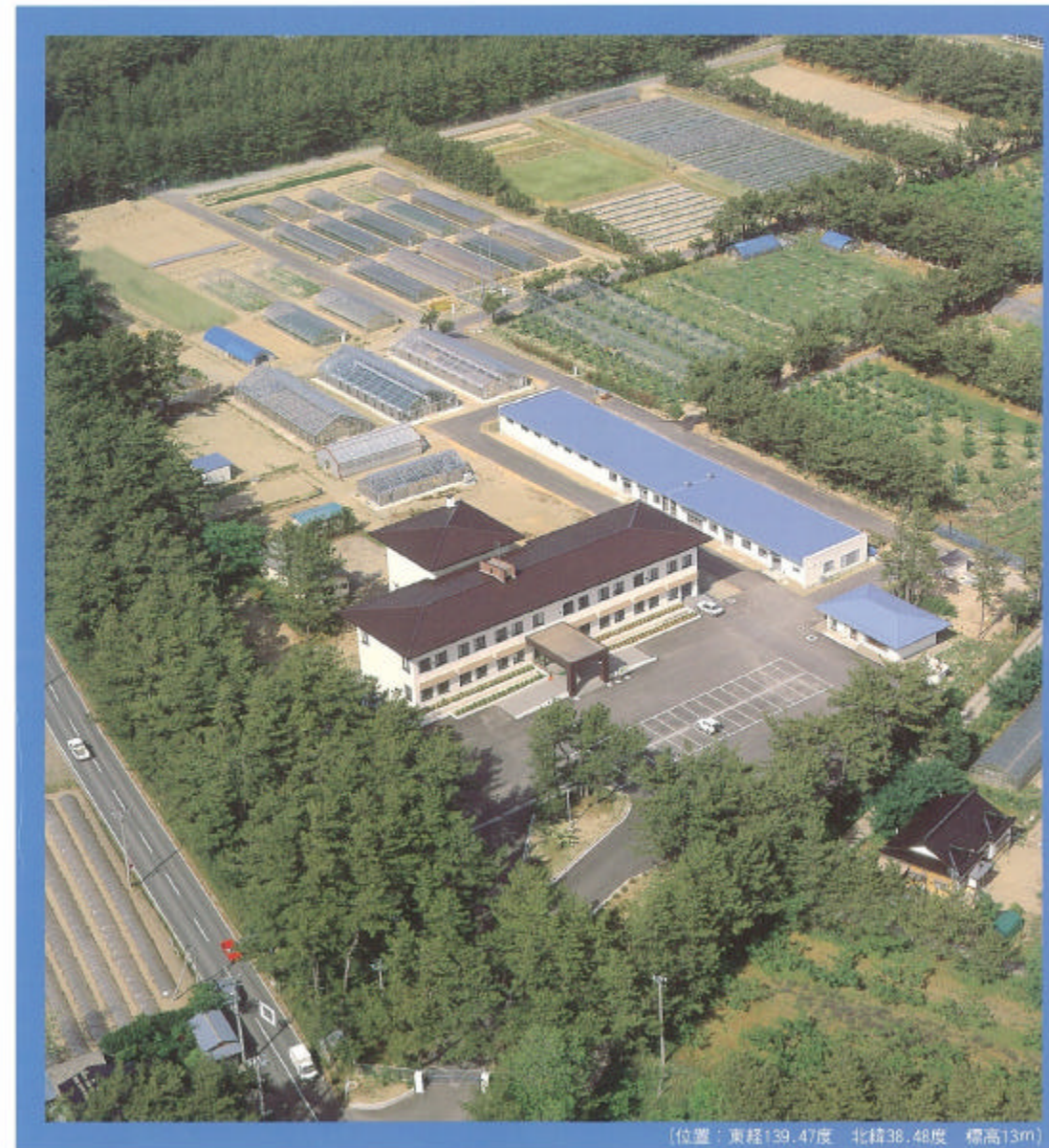
[位置：東経139.47度 北緯38.48度 標高13m]