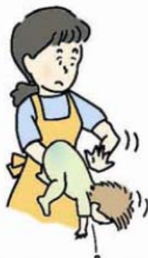
図 1 背部叩打法 (乳児)

乳幼児では、口の中に指を入れずに、乳児は片腕にうつ伏せに乗せ顔を支えて (図 1)、また、少し大きい子は立て膝で太ももがうつ伏せにした子のみぞおちを圧迫するようにして (図 2)、どちらも頭を低くして、背中の中を平手で何度も連続して叩きます。なお、腹部臓器を傷付けないよう力を加減します。