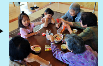
休館中のデイサービスセンターを活用したコミュニティカフェ