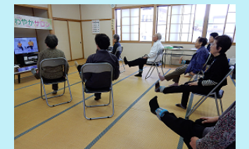
公民館を活用した健康づくり体操