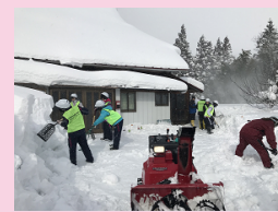
高校生の除雪ボランティア