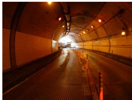
【A進行方向からの見とおし】