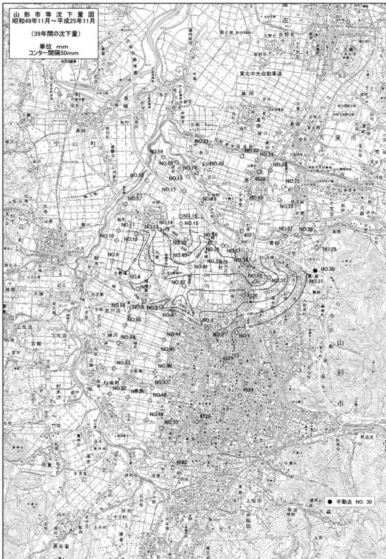
資料-107 等沈下量図（山形市）昭和49年11月～平成25年11月（単位：mm）