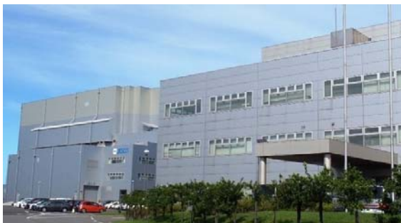
■ 北海道PCB処理事業所

良好な環境の保全を目的に、全国に5箇所あるPCB処理事業所において、安全で確実な処理と情報を重視してPCBの無害化処理に取り組んでいます。