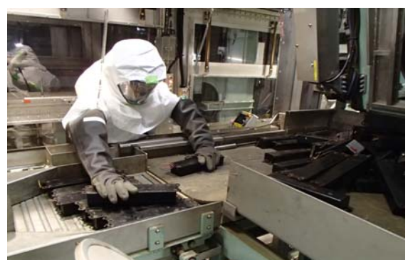
■ 安定器の処理作業