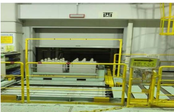
■ コンデンサの処理作業