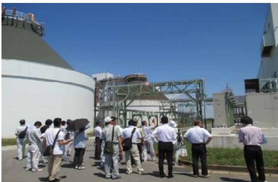
H27.7.22 天童市:山形浄化センター 下水汚泥による消化ガス発電設備視察