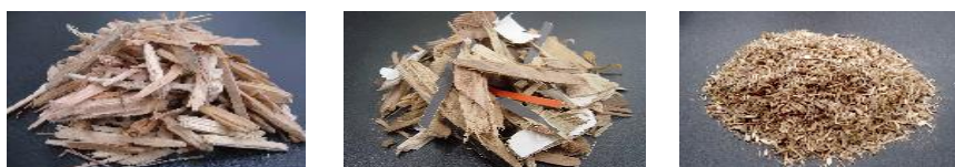
各種木材資源リサイクル製品（木質リサイクルチップ）